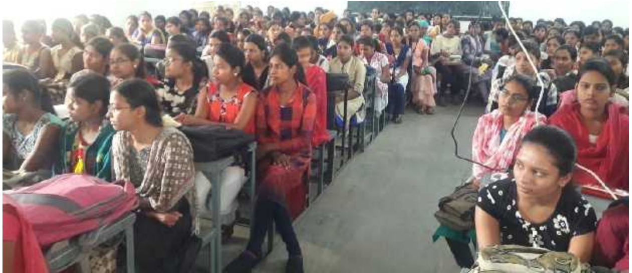
Sanetary Pad Machine Donation by Lions Club